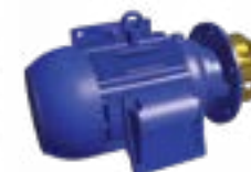
Pompe de pulvérisation sans volute