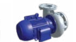
Pompe de pulvérisation avec volute