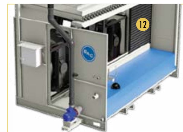
Uniquement pour les modèles de la génération précédente PLC 12. Déflecteurs d'entrée d'air à 3 fonctions