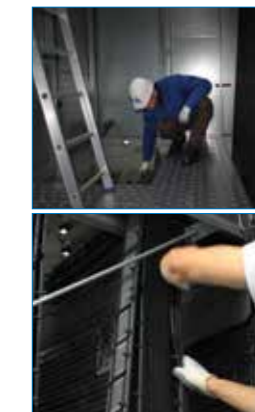
Relleno BACross patentado para limpieza e inspección hoja a hoja