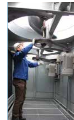
Sistema de accionamiento del ventilador fácilmente accesible mientras está parado